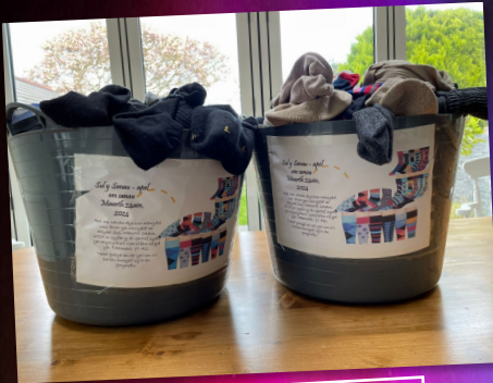
2 dwba Sul y Sanau