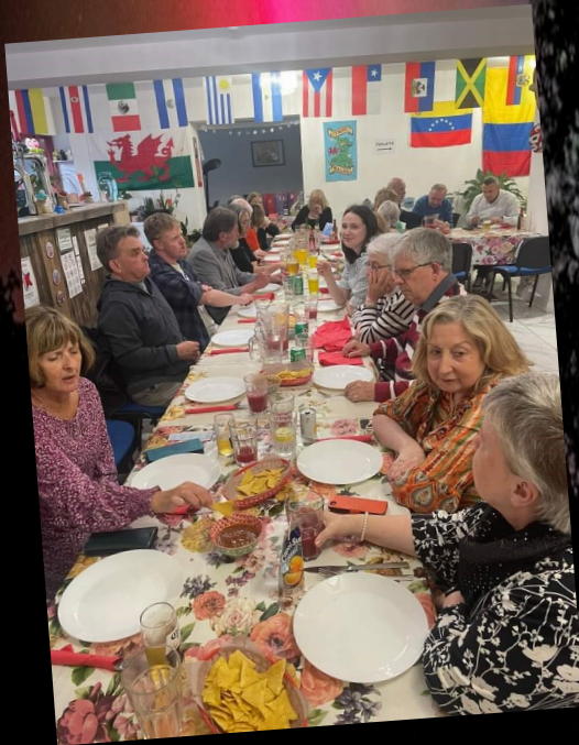
Noson ym mwyty 'Wings of Glory', Glanrafon i godi arian i Ffynhonnau Byw.