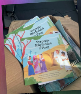
Llyfrynau Pasg Cymdeithas y Beibl— aeth 120 l ddisgyblion hynaf Melin Gruffydd.