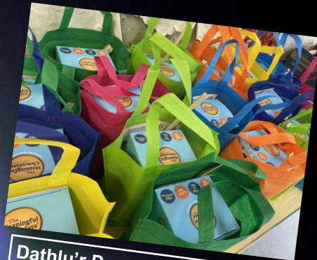
Dathlu'r Pasg yn Llanllanast